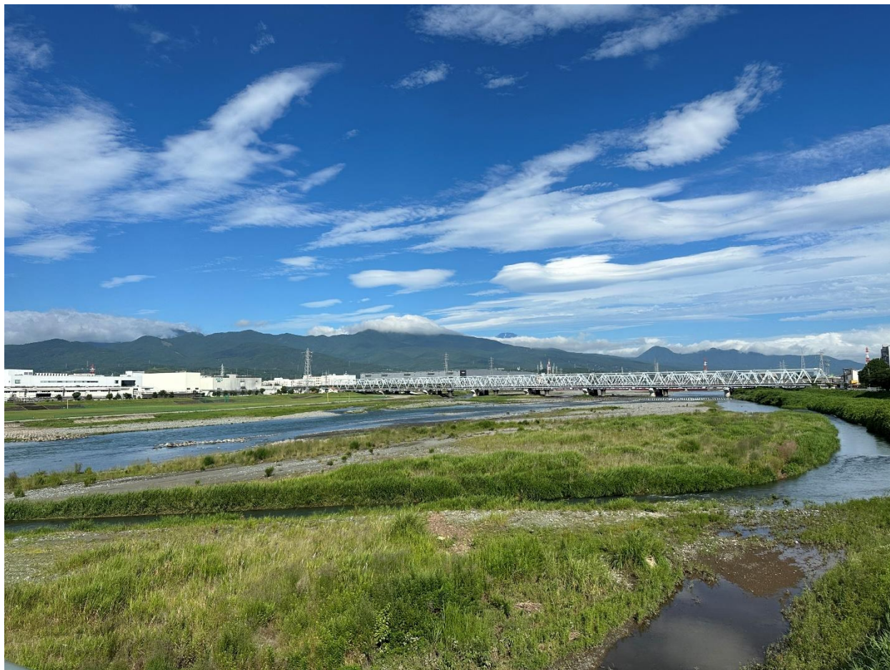
娘の送り迎えで通る小田原大橋からの風景