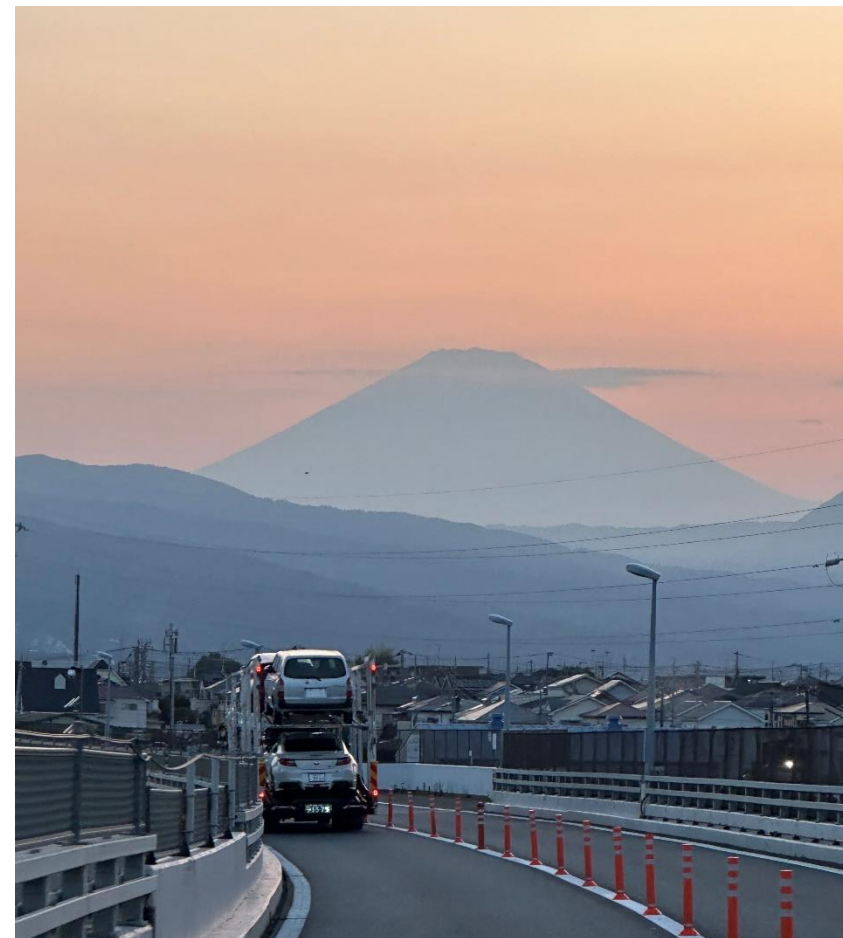
小田厚道から見える富士山