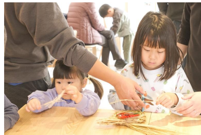
ものづくりWSイベント