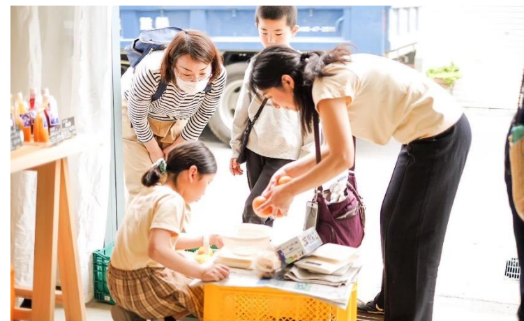
マルシェイベント